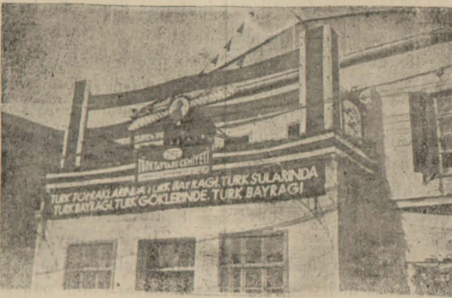
Bayram münasebetiyle Süslenen Tayyare Cemiyeti Binası

Himayeî el-fahri bediasında yine aynı gaye ile manalandıran ince bir zevk eseri idi. Bedialardan sonra Belediye Etfaiye arabaları geçti ve onu takiben de Halk Fırkası ocakları ve halk geçerek geçit resmi hitam buldu. — Gerisi 2. cide —