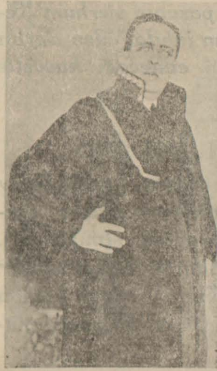
Mersin C. M. umumisi Şeref B.

Efkârı umumiye davayı yakından takip ediyor. Muhakemeye yarında devam edilecek